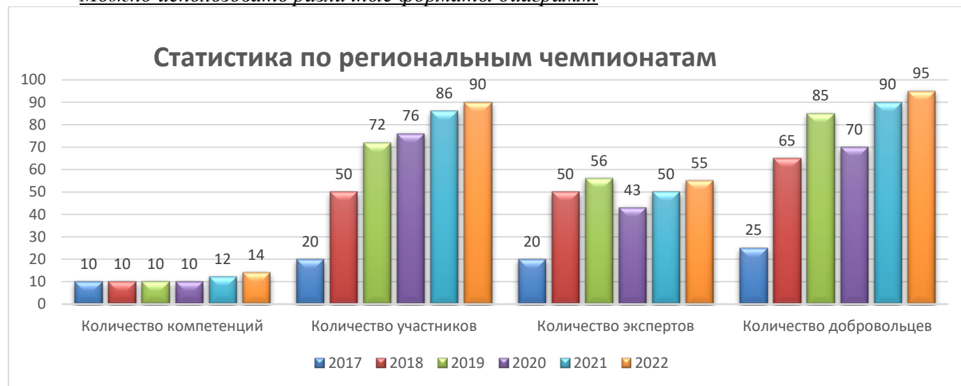
Рисунок 1 Название рисунка

Можно использовать различные форматы диаграмм.