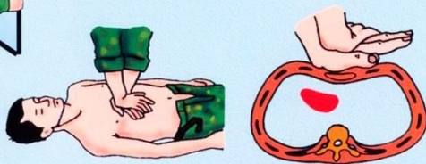
Непрямой массаж сердца