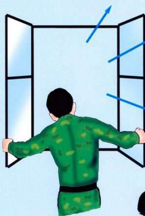
Обеспечение притока свежего воздуха

НЕ РЕКОМЕНДУЕТСЯ проводить искусственное дыхание способом изо рта в рот без использования специальных масок. В случае потери сознания и при наличии пульса на сонной артерии повернуть пострадавшего на живот, приложить к голове холод, вызвать скорую помощь